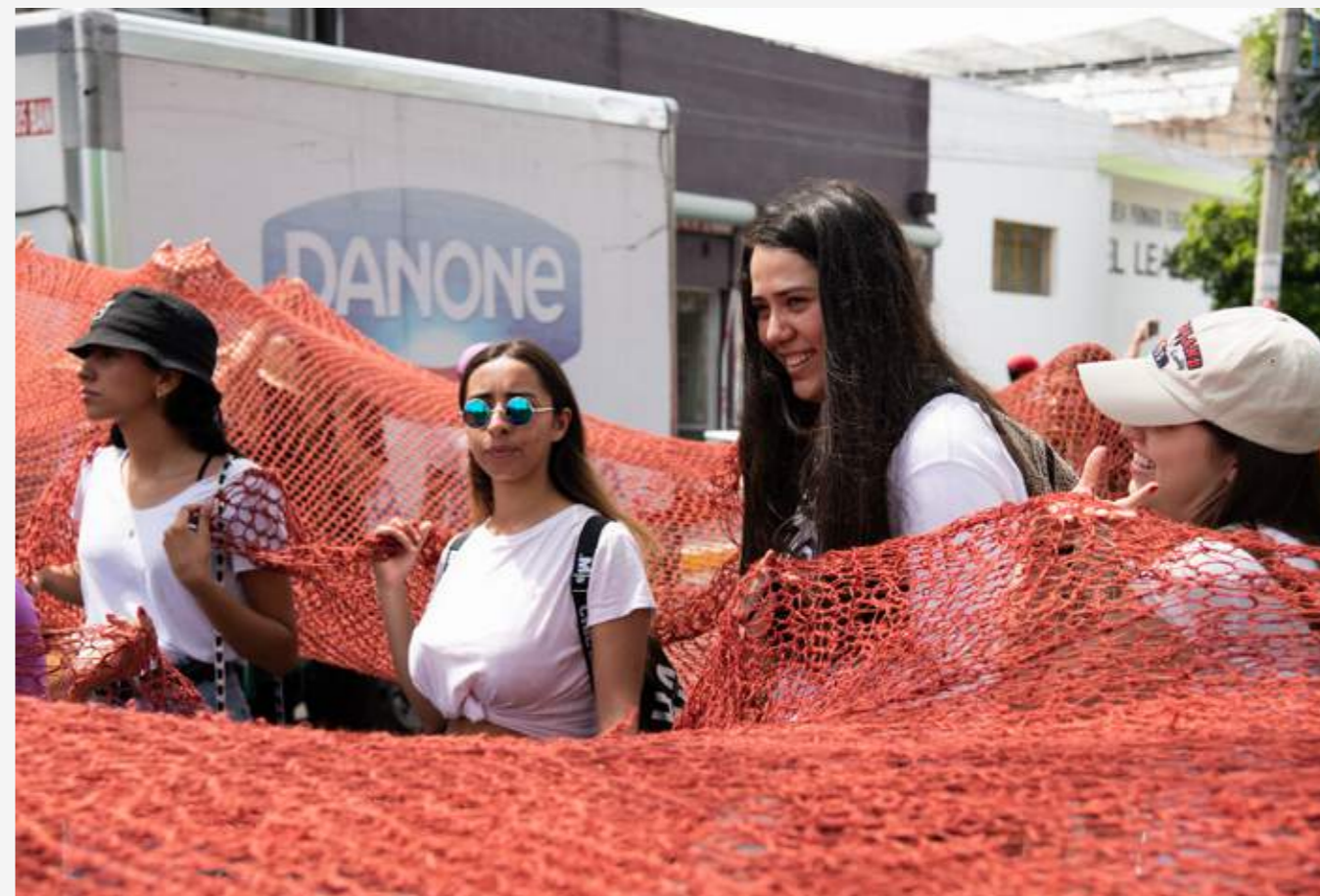
På väg med den virkade blodfläcken "Sangre de mi sangre" mot De försvunnas rondell med något hundratal deltagare. Dagen efter, internationella kvinnodagen 8 mars, genomfördes en av de största demonstrationerna någonsin i Jalisco. 35 000 kvinnor deltog. Temat var då till stor del feminicidios (hatbrottet kvinnomord) och desapariciones (de försvunna är dödade, om de alls återfinns).

– Det utvecklas och förändras hela tiden. Från början hette det grammatiskt korrekt Colectivo Hilos , inte den feminina formen Colectiva . Namnbytet skedde när det stod klart att