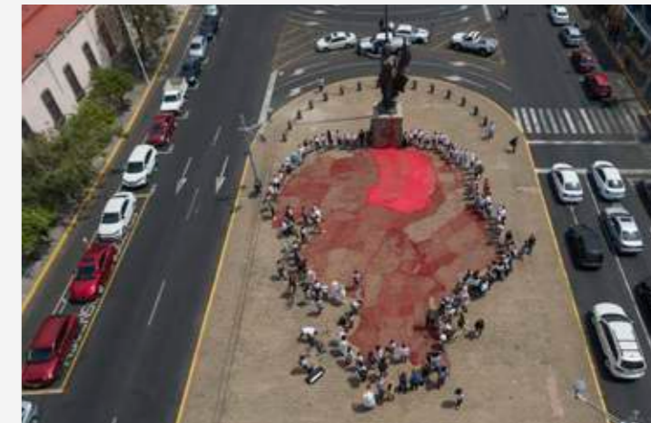
En överblick av torget och statyn.