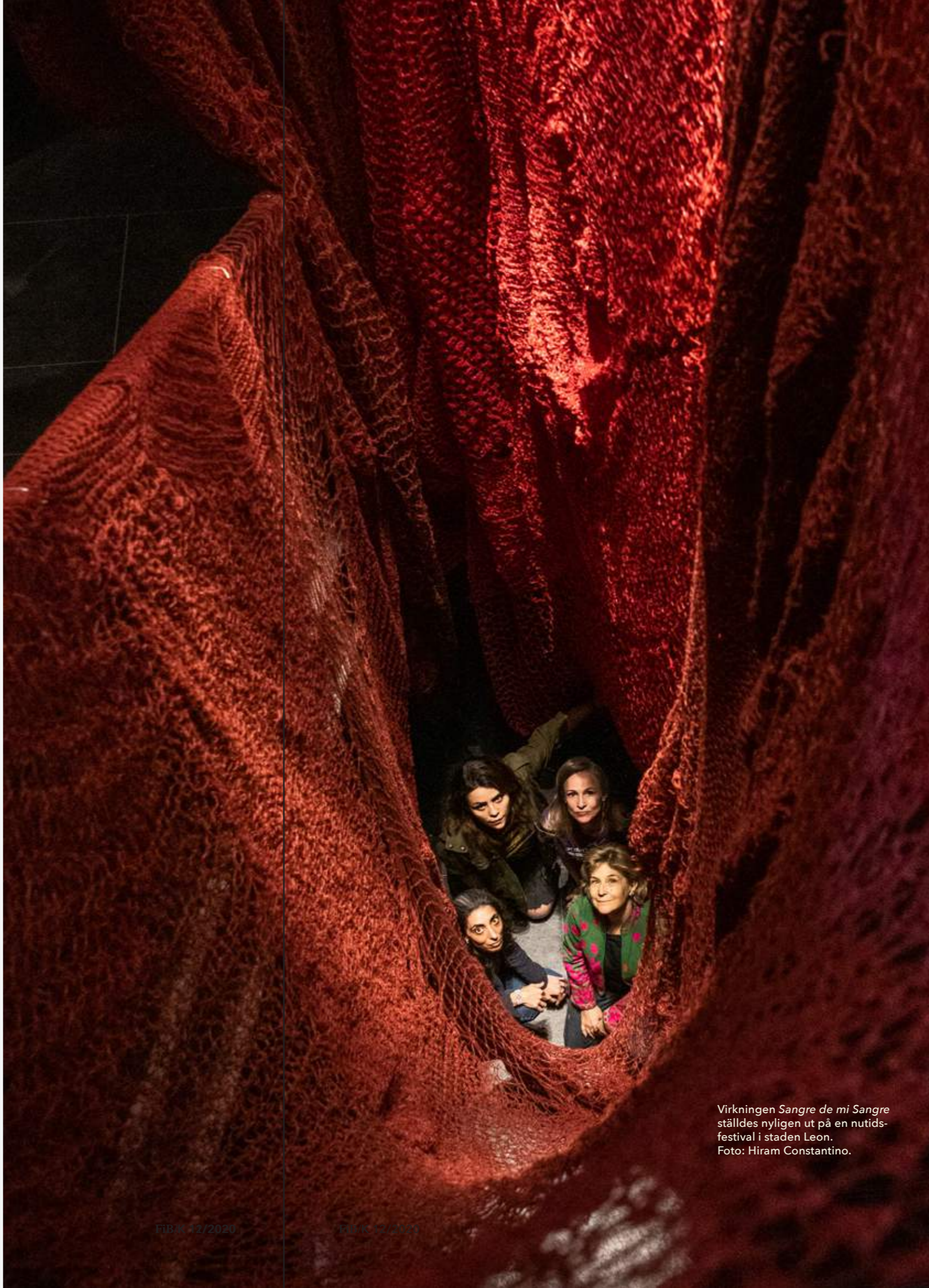
Virningen Sangre de mi Sangre ställdes nyligen ut på en nutidsfestival i staden Leon.